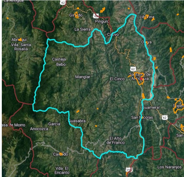
Figura 1.1. Mapa del municipio de Santa Fe de Antioquia