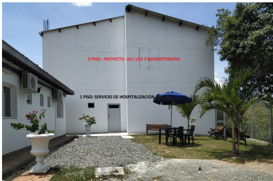
Fotografía 1.1. Fachada Oriental bloque Hospitalización – ESE San Juan de Dios Santa Fe de Antioquia

Este bloque fue construido entre 2019 y 2020 por Asociación de Municipios del Altiplano del Oriente Antioqueño MASORA.