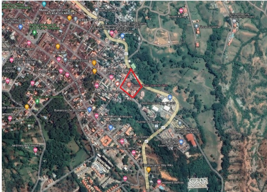
Figura 1.3. Mapa del municipio de Santa Fe de Antioquia – Cabecera Municipal - Sede Principal ESE San Juan de Dios