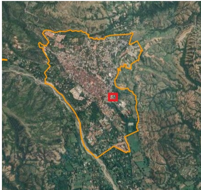
Figura 1.2. Mapa del municipio de Santa Fe de Antioquia - Cabecera Municipal

AMPLIACIÓN DE LA INFRAESTRUCTURA FÍSICA DE LA EMPRESA SOCIAL DEL ESTADO HOSPITAL SAN JUAN DE DIOS DEL MUNICIPIO DE SANTA FE DE ANTIOQUIA.