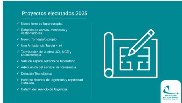
Torre de laparoscopia